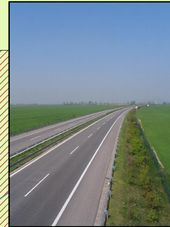
Obr. 1 Diaľnica D2 (Brodské - Bratislava - Čumovo) (Galážová, 2009)