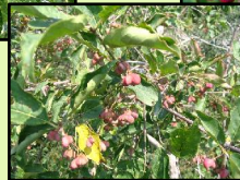
Obr. 7 Detail plodu brléna európskeho ( Euonymus europaeus L. ) (Galážová, 2009)