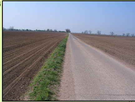
Obr. 2 a Obr. 3 Poľné cesty spevnené v území CHVÚ Syaľovské polia. (Galážová, 2009)