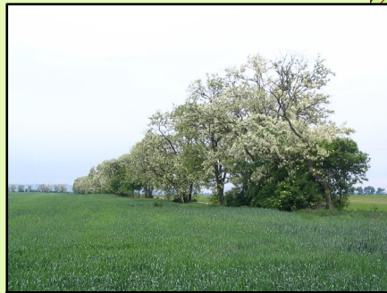
Obr. 4 Nelesná drevinová vegetácia v CHVÚ Syaľovské polia. Dominantné postavenie má agát biely ( Robinia pseudoacacia L. ). (Galážová, 2009)