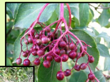
Obr. 8 Detail plodu bazy čiernej ( Sambucus nigra L. ) (Galážová, 2009)