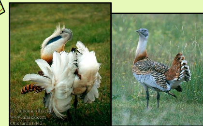
Obr. 12 a Obr. 13 Drop fúzatý ( Otis tarda )