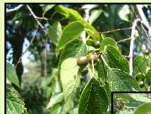
Obr. 6 Detail plodu brestovca západného ( Celtis occidentalis L. ). (Galážová, 2009)