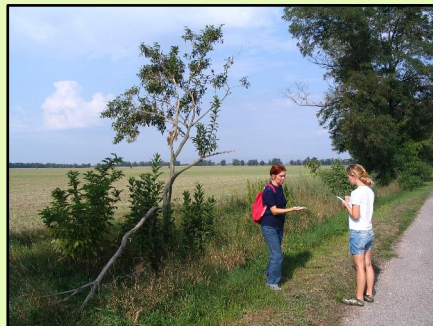
Obr. 5 Záujmový porast - zprava poľná cesta spevnená, zľava poľnohospodársky obrábaná pôda. (Galážová, 2009)