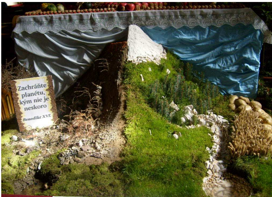
Príloha 2 Roľnícka nedeľa