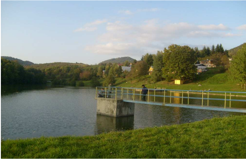
Príloha 4 Vodná nádrž Tajch