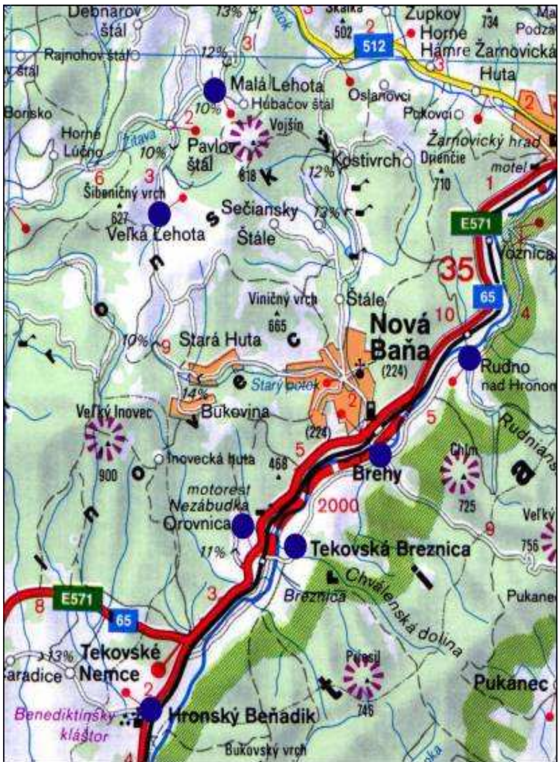
Príloha 1 Mikroregión Nová Baňa