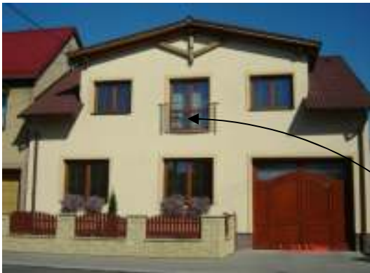
Obr.9 Riešený objekt č.1 (L'ahká, 2008)