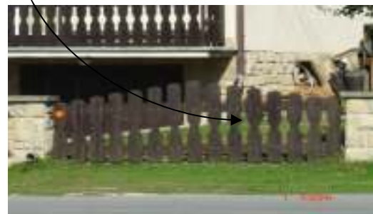
Obr.13 Pôvodné oplotenie (L'ahká, 2008)