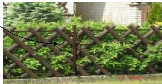
Obr. 23 Pôvodné oplotenie (L'ahká, 2008)

Vzhľadom na výšku domu je primeraná výška oplotenia