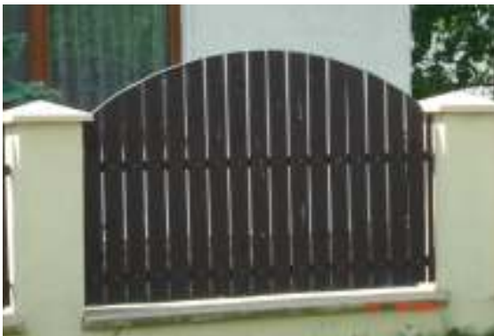
Obr. 15 Pôvodné oplotenie (L'ahká, 2008)

Navrhované riešenie: Oplotenie je v súlade s celkovou líniou domu.