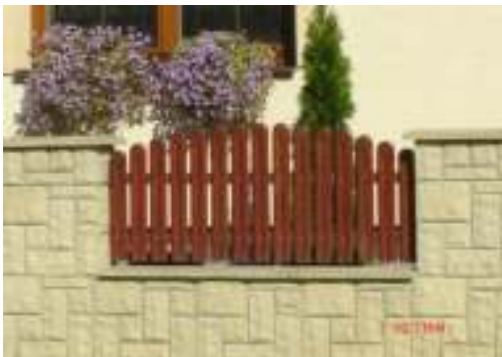
Obr.10 Pôvodné oplotenie (L'ahká, 2008)