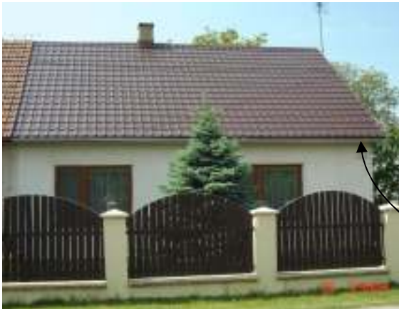
Obr. 14 Riešený objekt č.3 (L'ahká, 2008)

Navrhované riešenie: Oplotenie je v súlade s celkovou líniou domu.