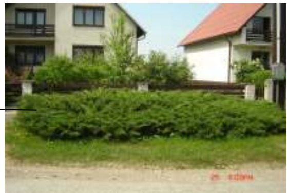
Obr. 30 Riešený objekt č.10 (Ľahká, 2008)

Predzáhradka z jedného druhu drevín pôsobí monotónne, fádne.