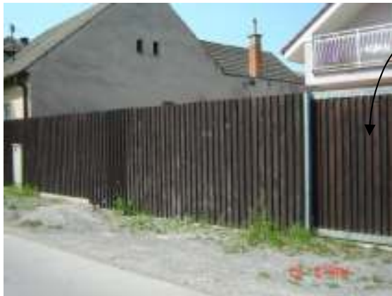
Obr. 20 Pôvodný stav (L'ahká, 2008)