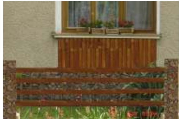
Obr. 26 Navrhované riešenie (L'ahká, 2008)