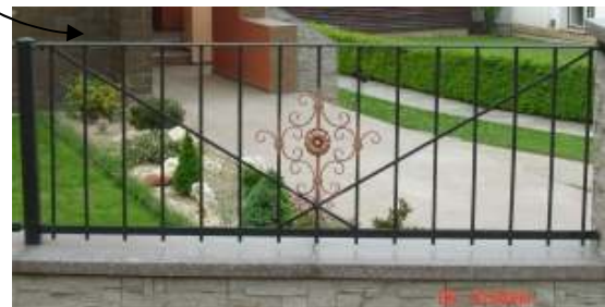
Obr.18 Pôvodné oplotenie (L'ahká, 2008)

Správne riešenie tvaru oplotenia: Oplotenie je v súlade s celkovým tvarom domu.