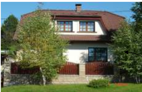
Obr. 31 Riešený objekt č.11 (Ľahká, 2008)