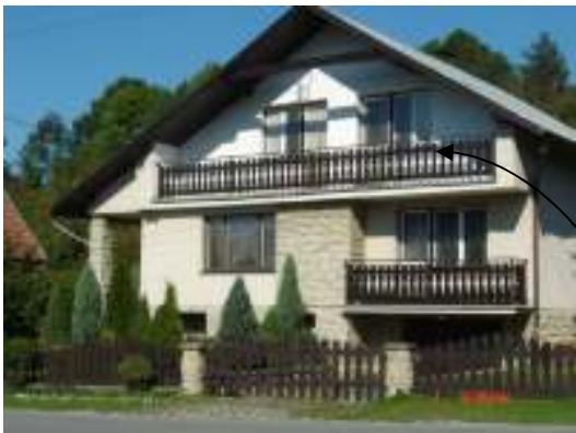
Obr.12 Riešený objekt č.2 (L'ahká, 2008)

Zosúladiť oplotenie so zábradlím na balkóne.