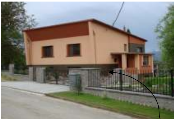
Obr. 17 Riešený objekt č.4 (L'ahká, 2008)

Správne riešenie tvaru oplotenia: Oplotenie je v súlade s celkovým tvarom domu.