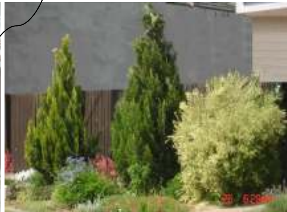
Obr. 21 Navrhovaný stav (L'ahká, 2008)