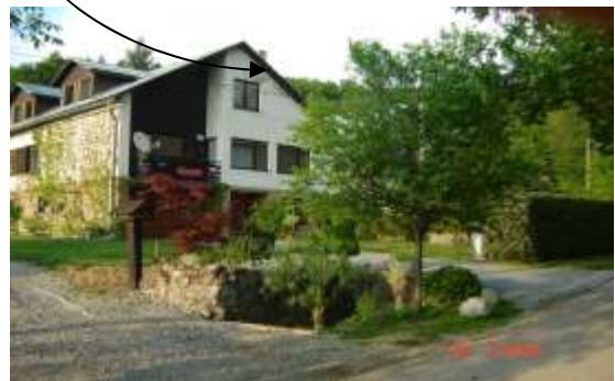
Obr.32 Riešený objekt č.12 (Ľahká, 2008)

Domáce druhy drevín ( Betula , Prunus ) sa hodia do vidieckeho prostredia