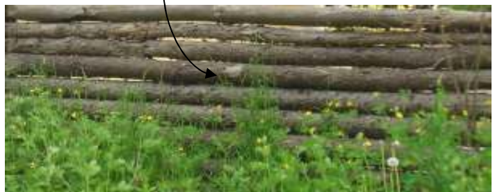
Obr. 28 Pôvodné oplotenie (L'ahká, 2008)

Prírodný materiál oplotenia- drevo veľmi dobre zapadá do vidieckeho prostredia.