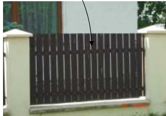
Obr. 16 Navrhované oplotenie (L'ahká, 2008)