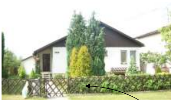
Obr. 22 Riešený objekt č.6 (L'ahká, 2008)