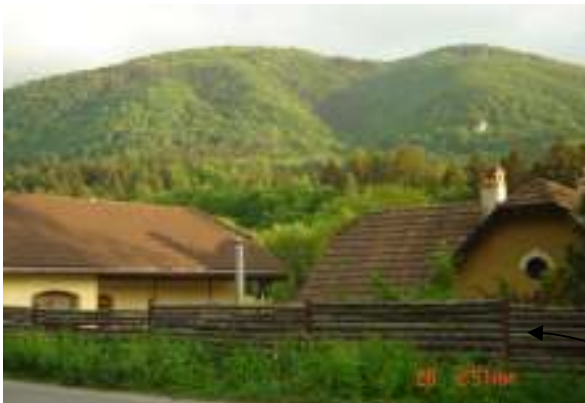
Obr. 27 Riešený objekt č.8 (L'ahká, 2008)