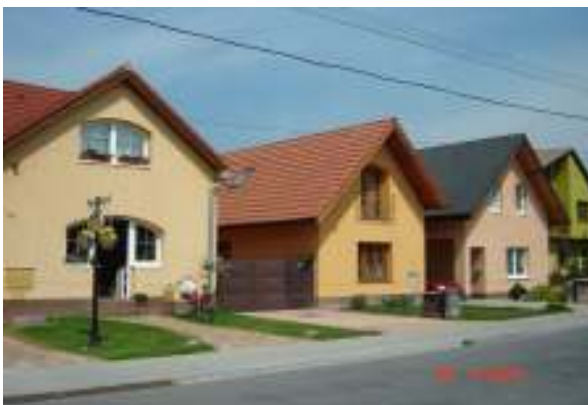
Obr.36 Riešená ulica č.1 (L'ahká, 2008)

Oplotenie vzhľadom na uličný priestor pôsobí nejednotne-výškou, materiálom a celkovým dojmom