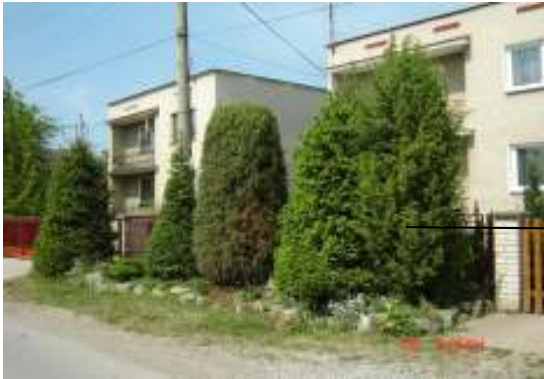
Obr. 29 Riešený objekt č.9 (Ľahká, 2008)