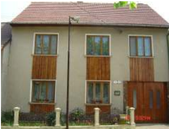
Obr. 24 Riešený objekt č.7 (L'ahká, 2008)