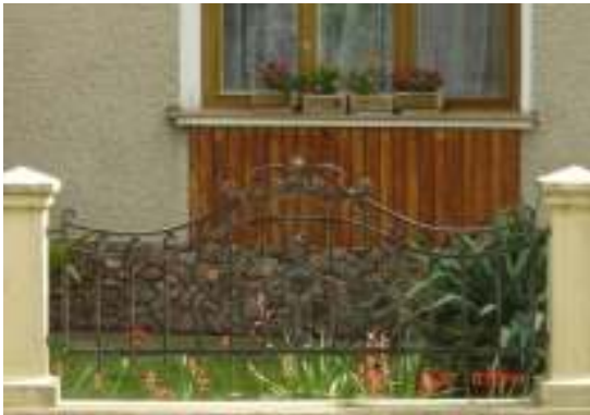
Obr. 25 Pôvodné riešenie (L'ahká, 2008)

Navrhované oplotenie sa zhoduje s obkladom a podmurovkou domu, horizontálne riešenie oplotenia opticky znižuje výšku domu.