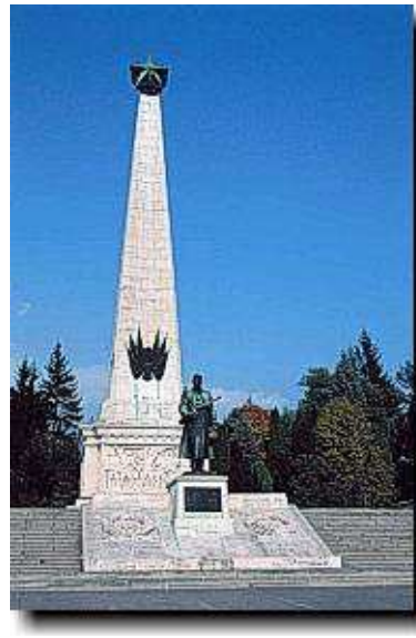
Obrázok 5: Pamätník vo Svidníku