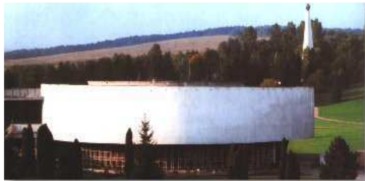
Obrázok 6: Vojenské múzeum vo Svidníku