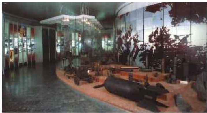
Obrázok 7: Expozícia vo Vojenskom múzeu