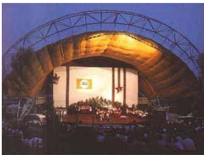
Obrázok 14: Slávnosti ukrajinských pracujúcich