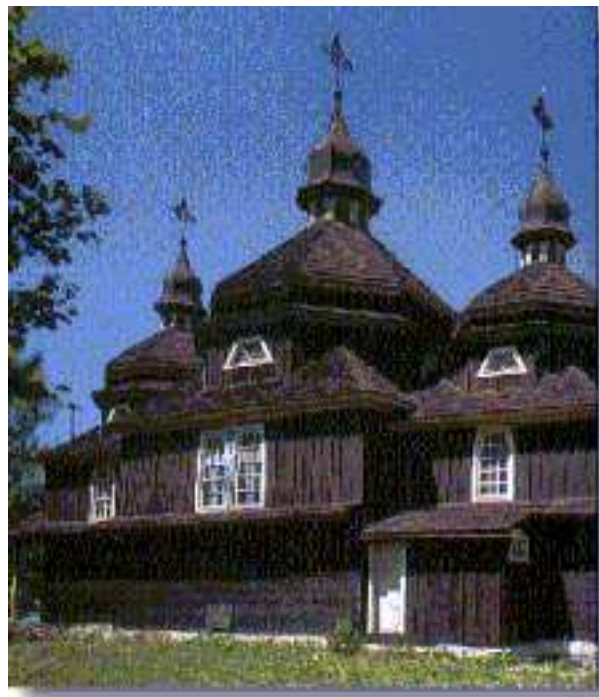
Obrázok 12: Kostolík v Nižnom Komárniku