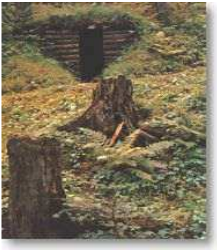
Obrázok 4: Bunker na Dukle