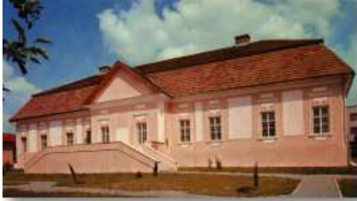
Obrázok 11: Galéria D. Millyho vo Svidníku