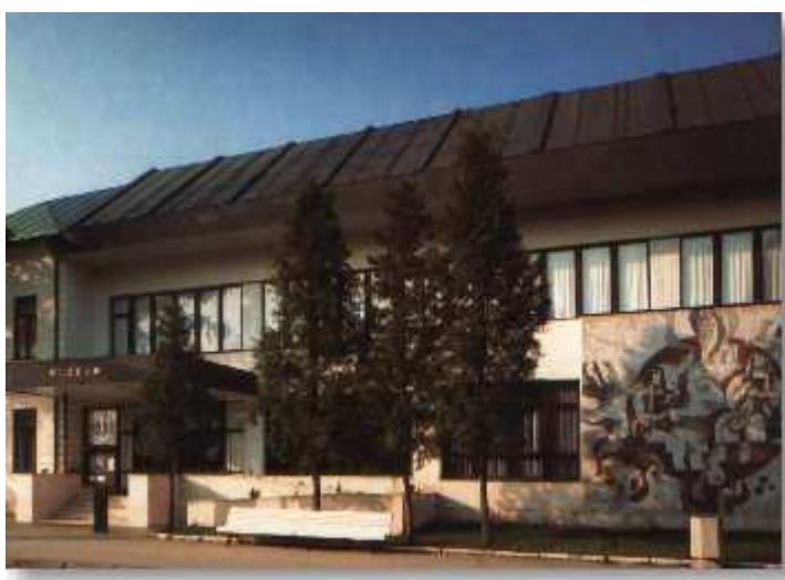
Obrázok 8: Múzeum Ukrajinskej kultúry vo Svidníku