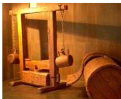
Obrázok 9 a 10: Expozícia v múzeu Ukrajinskej kultúry