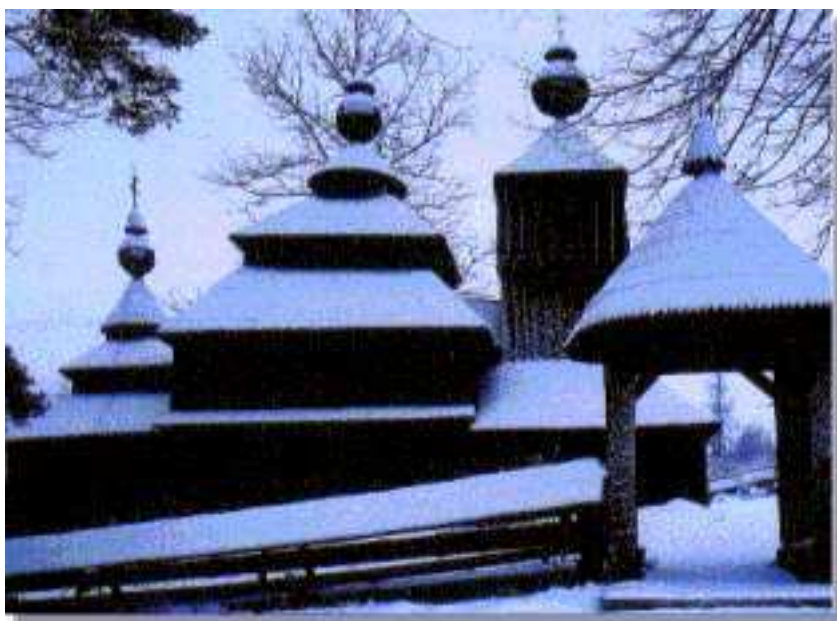
Obrázok 13: Kostolík v Bodružali