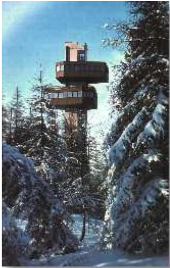
Obrázok 2 a 3: Pamätník na Dukle a vyhliadková veža na Dukle