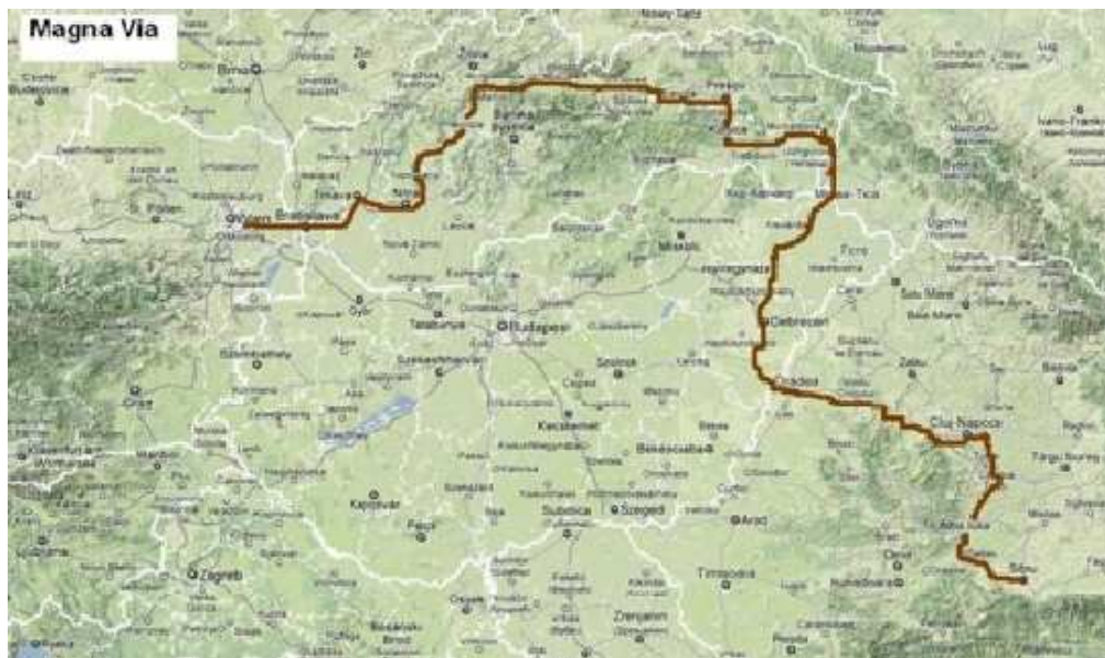
Obrázok č. 3 Magna via

Historická cesta Magna Via sa začínala vo Viedni odkiaľ cez Hainburg smerovala do Bratislavy (Presburg). Prechádzala Trnavou, Hlohovcom, cez Veľké Ripňany, Zemianske Kostolany a Vestenicu do Prievidze. Z Prievidze cesta smerovala do Martina, kde sa ztočila na východ a cez Ružomberok a Liptovský Hrádok do Popradu. Z Popradu sa Magna Via tiahla do Levoče, ďalej cez Spišské Podhradie do Prešova. V Prešove sa cesta stáčala opäť na juh smerom na Košice, odkiaľ cez Michalovce na územie Zakarpatska, ďalej do Užhorodu a do Mukačeva (Mukácz). Tu sa cesta opäť otáča smerom na Vásárosnamény (Namény), do Debrecénu. Odtiaľ cez Pocsay k hraniciam Sedmohradska do Biharia (Bihar, Biharkeresztes) a do Oradei. Magna Via na území Sedmohradska pokračovala cez Borod, Hunyad (Huedin) do Cluj (Kluž, Koloszvár). Z Cluj sa cesta ďalej tiahla do Turdy a Alba Iulie a do konečnej stanice Sibiu.