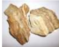
Levický zlatý ónyx