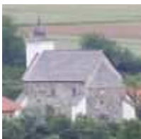
Románsky kostol v Kalinčiakove