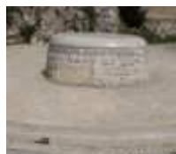
Pamätník Milénium 2000