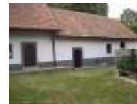
Bohunický vodný mlyn