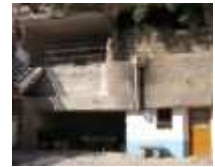
Skalné obydlia v Brhlovciach