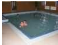
Kúpele a wellness v Santovke