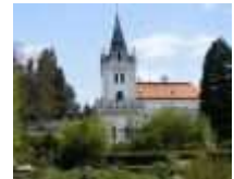
Kaštieľ Arborétum Mlyňany