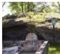
Travertínová kopa Santovka