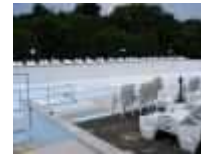
Kúpalisko v Santovke