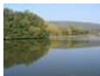
Vodná nádrž Jelenec