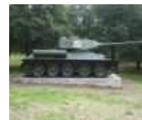
Tank z 2. sv. vojny v Kalnej nad Hronom