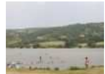
Vodná nádrž Bátovce