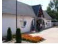
Termálne kúpalisko Podhájska