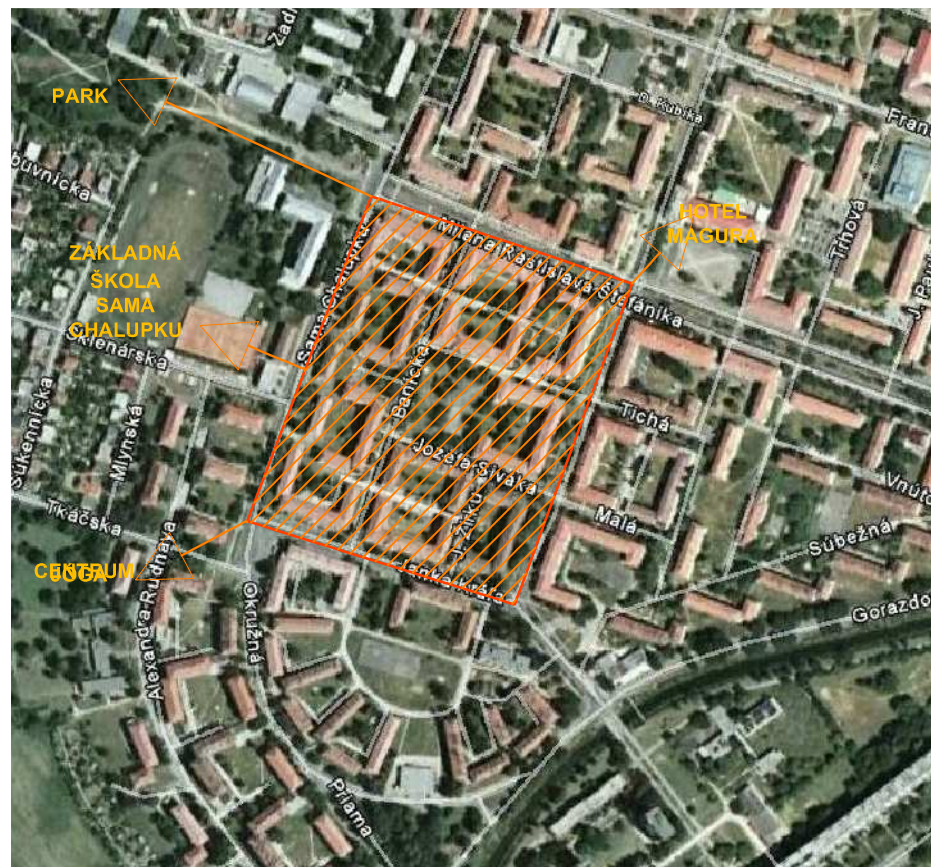
ZÁUJMOVÉ ÚZEMIA V OKOLÍ RIEŠENEJ HBV