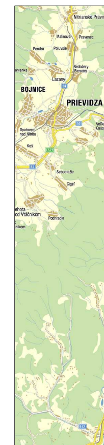
SUSEDIACE MESTÁ PRIEVIDZE

SLOVENSKÁ POĽNOHOSPODÁRSKA UNIVERZITA V NITRE FAKULTA ZÁHRADNÍCTVA A KRAJINNEHO INŽINIERSTVA. KATEDRA ZÁHRADNEJ A KRAJINNEJ ARCHITEKTÚRY