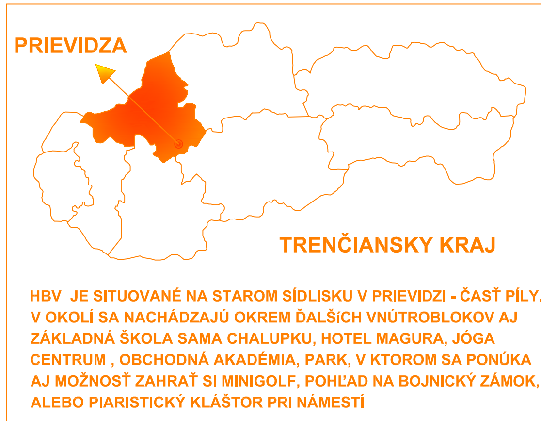
LOKALIZÁCIA ÚZEMIA V RÁMCI SLOVENSKA