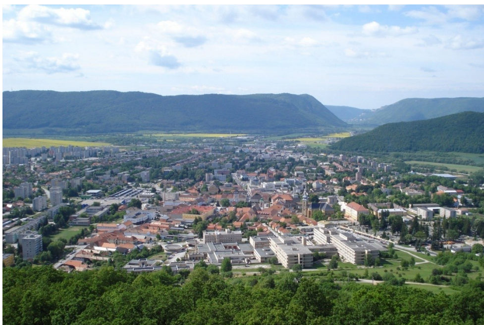
Obrázok č. 9: Mesto Rožňava.