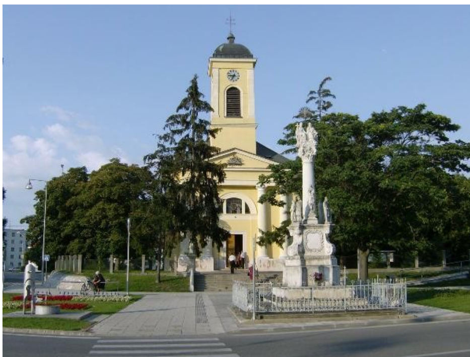
Obrázok č. 7: Námestie Sv. Trojice – Šaľa.