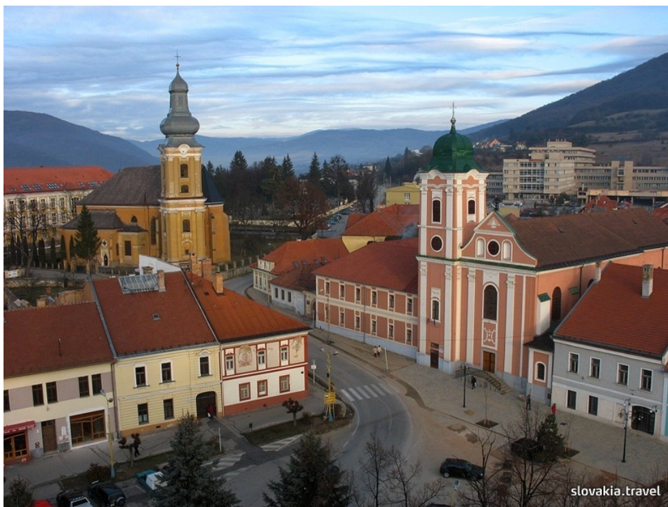
Obrázok č. 8: Námestie baníkov – Rožňava.