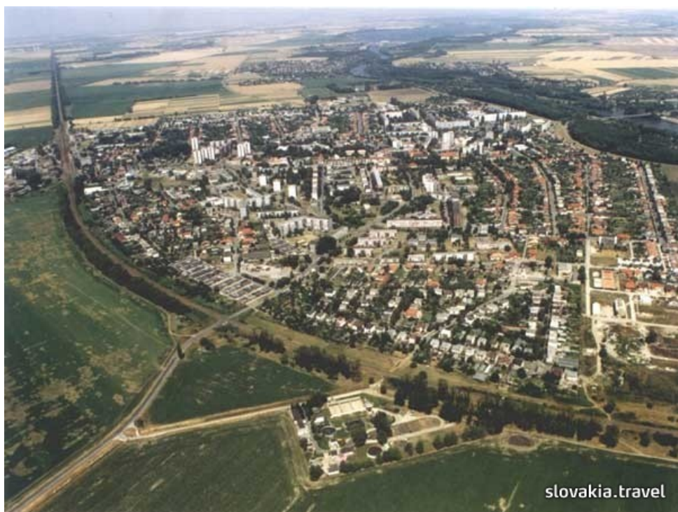
Obrázok č. 9: Mesto Šaľa.