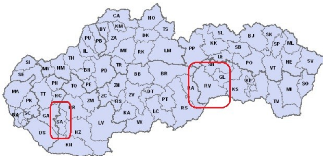
Obrázok č. 3: Poloha okresov Šaľa a Rožňava v rámci Slovenskej republiky.