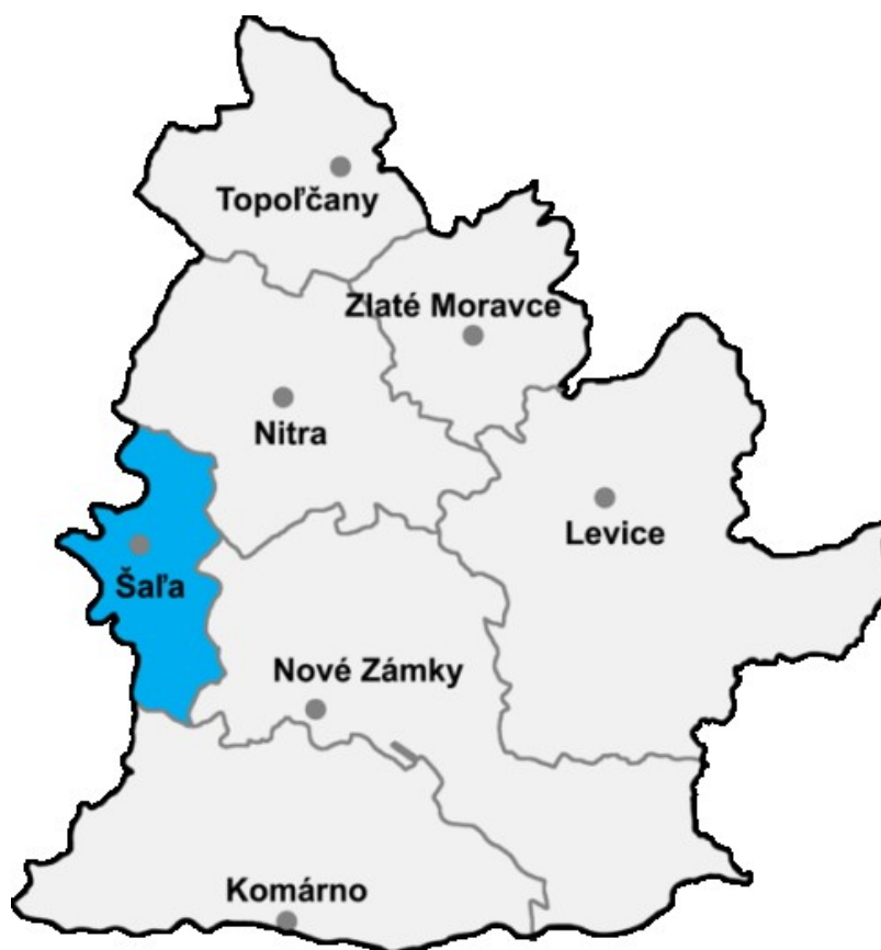
Obrázok č. 5: Okres Šaľa v rámci Nitrianskeho kraj.