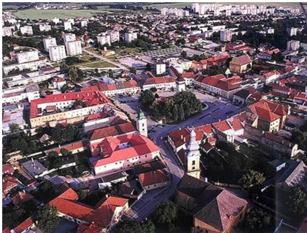
Obrázok č. 4: Námestie baníkov – Rožňava.