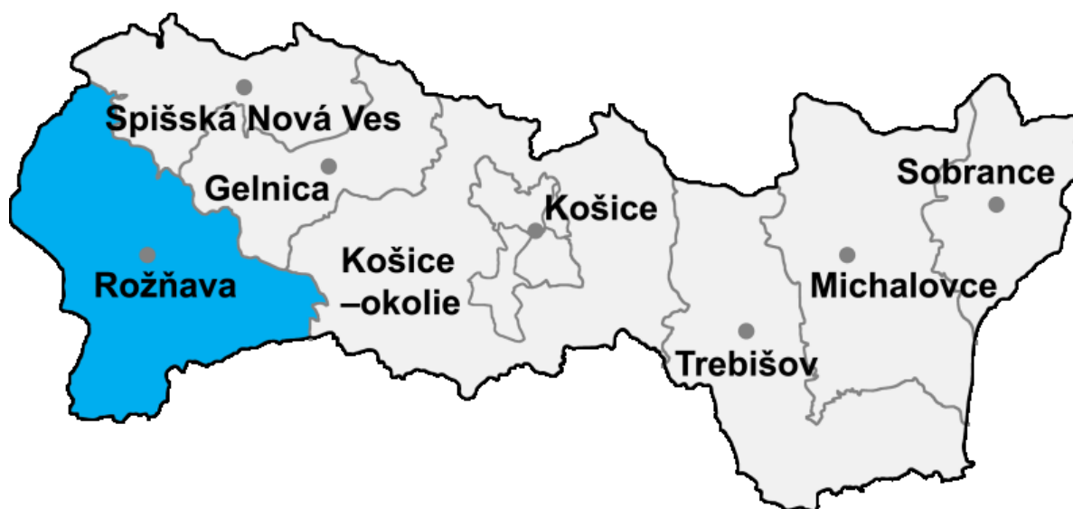
Obrázok č. 6: Okres Rožňava v rámci Košického kraja.