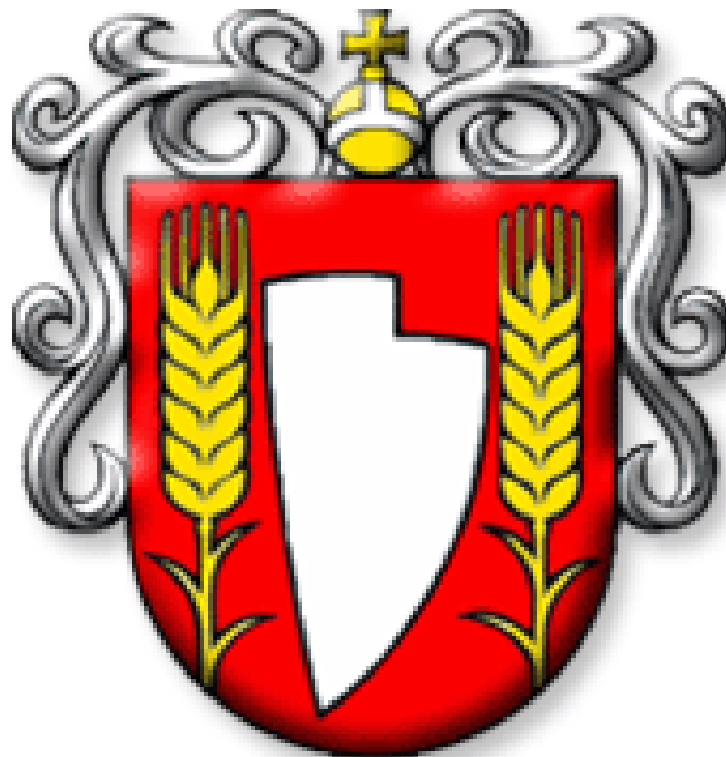
Obrázok č. 1: Erb mesta Šaľa.