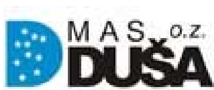
Príloha 2: Logo MAS Duša, o. z.