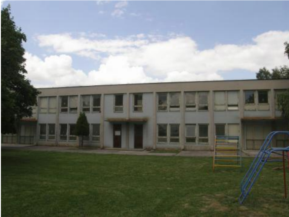
Obr. 2: MŠ pred rekonštrukciou