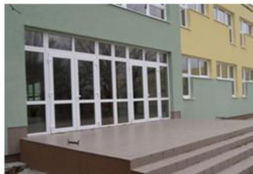
Obr. 4: Základná škola pred a po rekonštrukcii