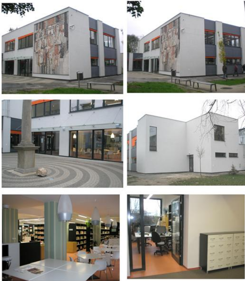
Obr. 7: Knižnica pred a po rekonštrukcii