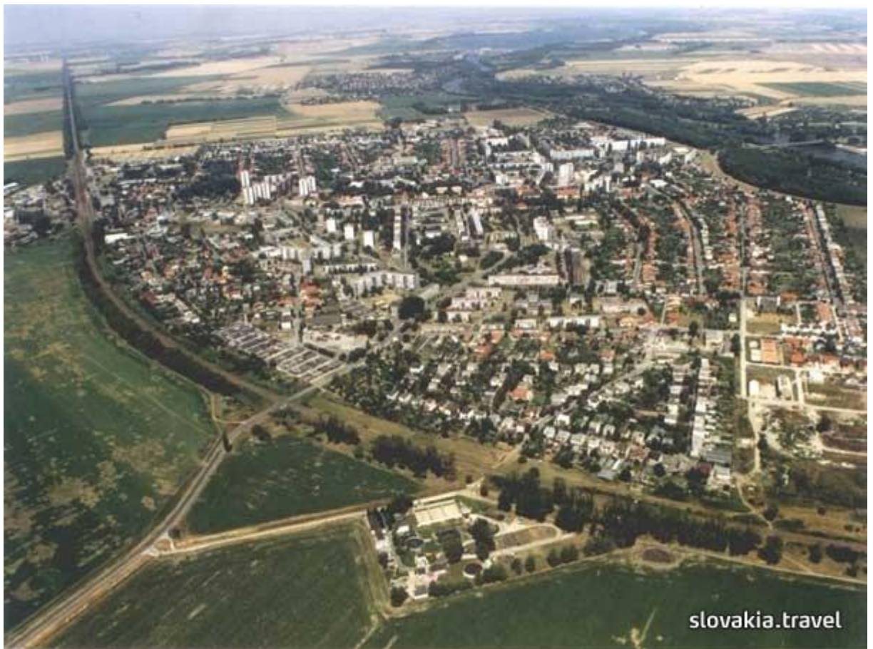
Obr. 1: Letecký náhľad mesta