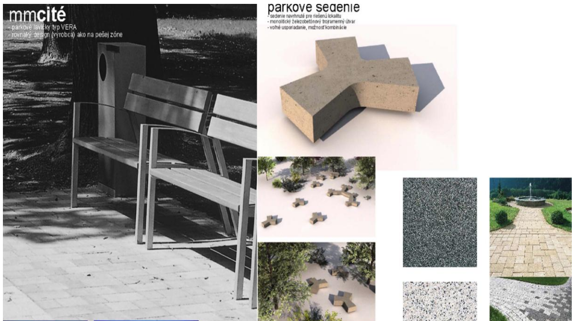
Obr. 6: Lavičky a navrhnutá dlažba na pešej zóne