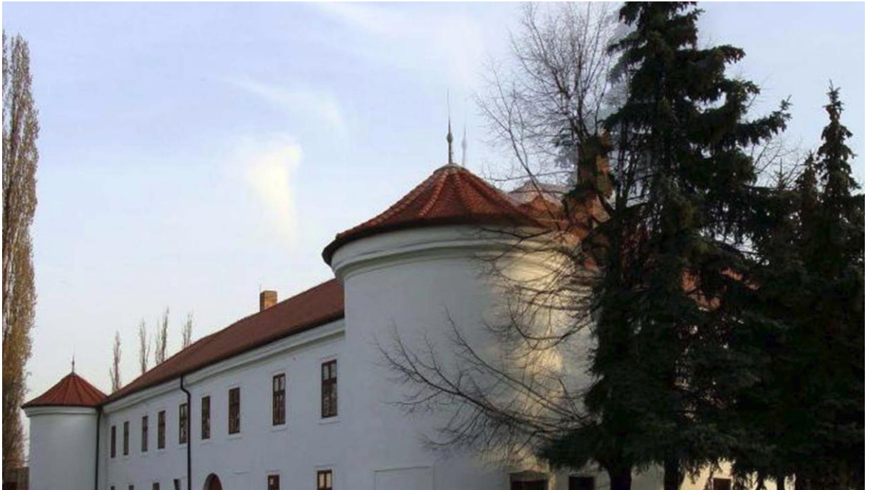
Obr. 5: Zrekonštruovaný kaštieľ