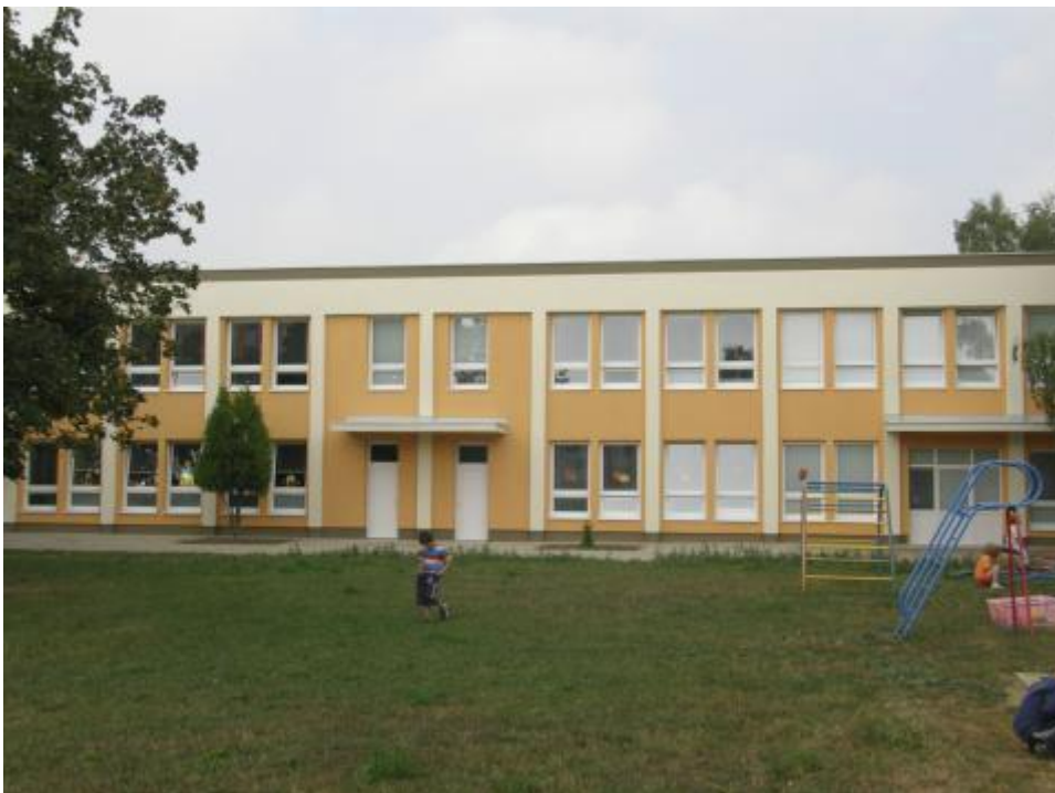
Obr. 3: MŠ po rekonštrukcii