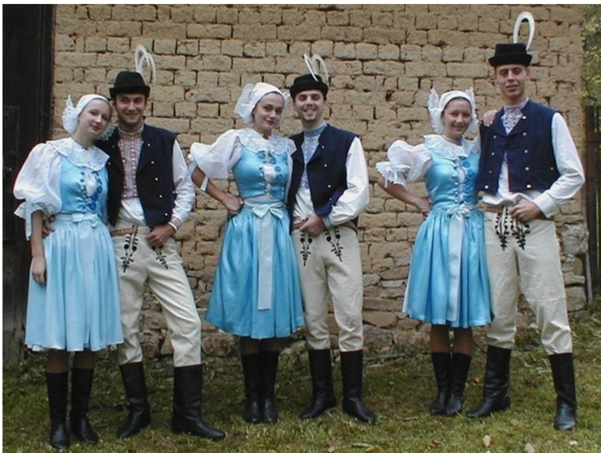
Obr.: Kroje obce Myjava