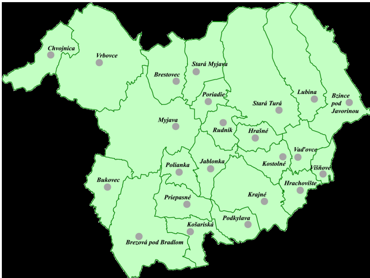
Obr. 1: Územie Veľká Javorina – Bradlo

Myjava je najväčšie mesto regiónu a súčasne najväčšie mesto myjavského okresu. Stará Turá je druhé najväčšie mesto novomestského okresu. Viac ako polovica obyvateľov žije v troch strediskových mestách v kategórii nad 5000 obyvateľov: Brezová pod Bradlom, Myjava a Stará Turá (67,4%).