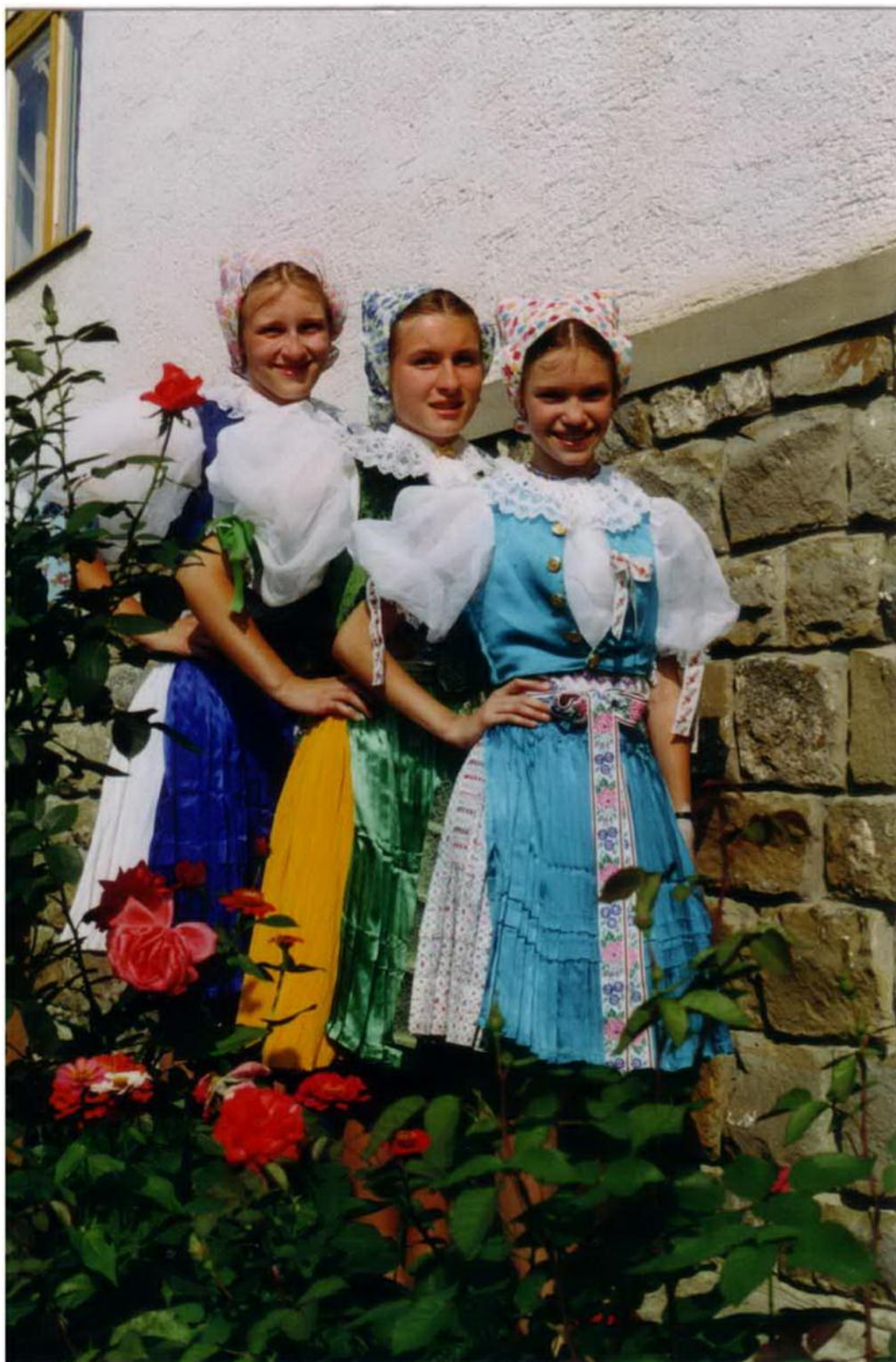
Obr.: Kroje obce Vrbovce