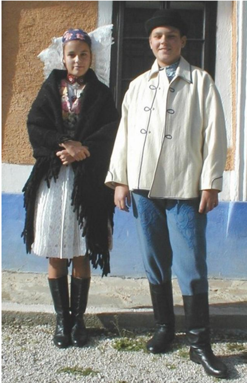
Obr.: Kroje obce Lubina (zdroj: < http://www.jankohrasko.sk >)