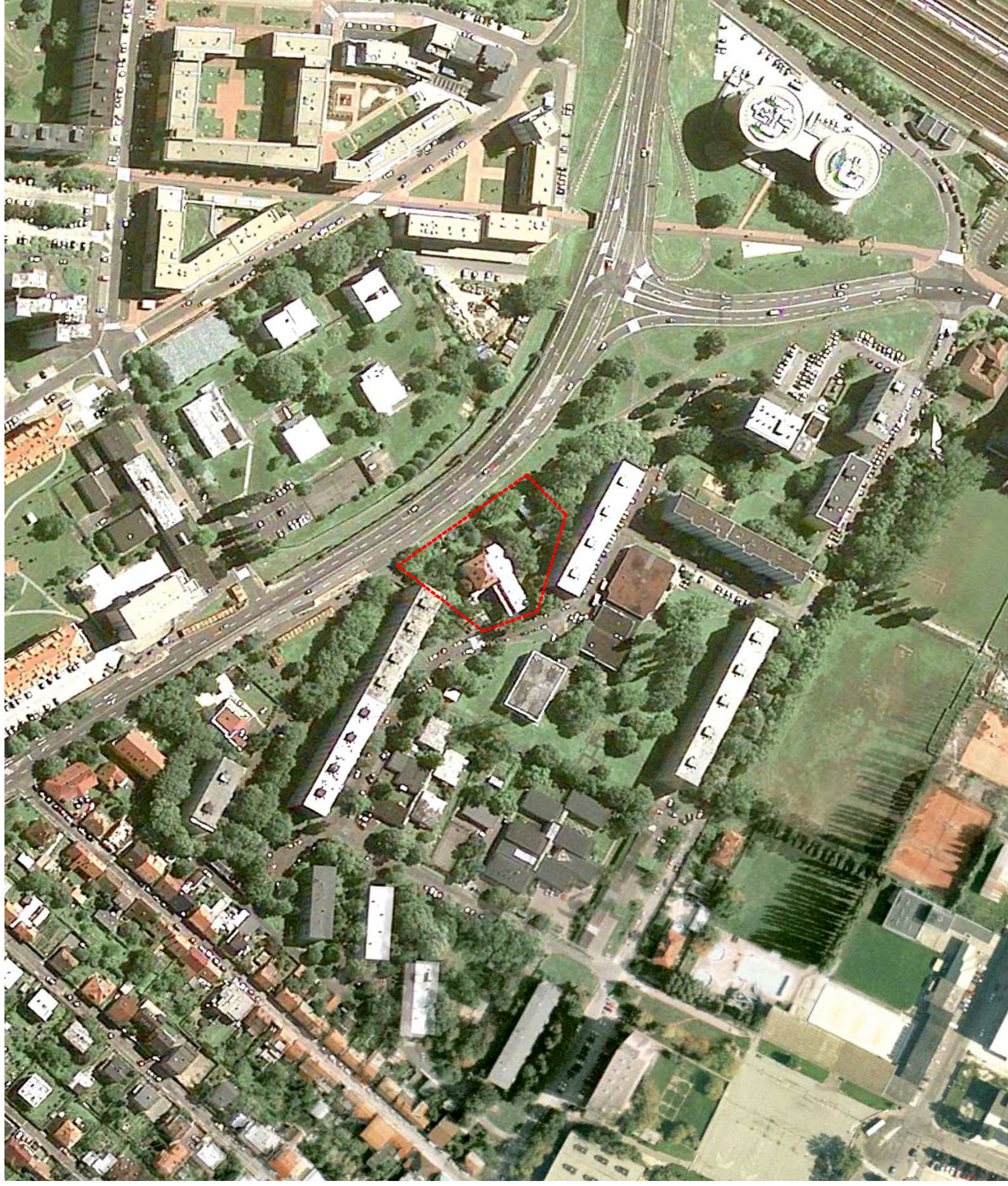
Ortofotomapa riešeného územia s okolím