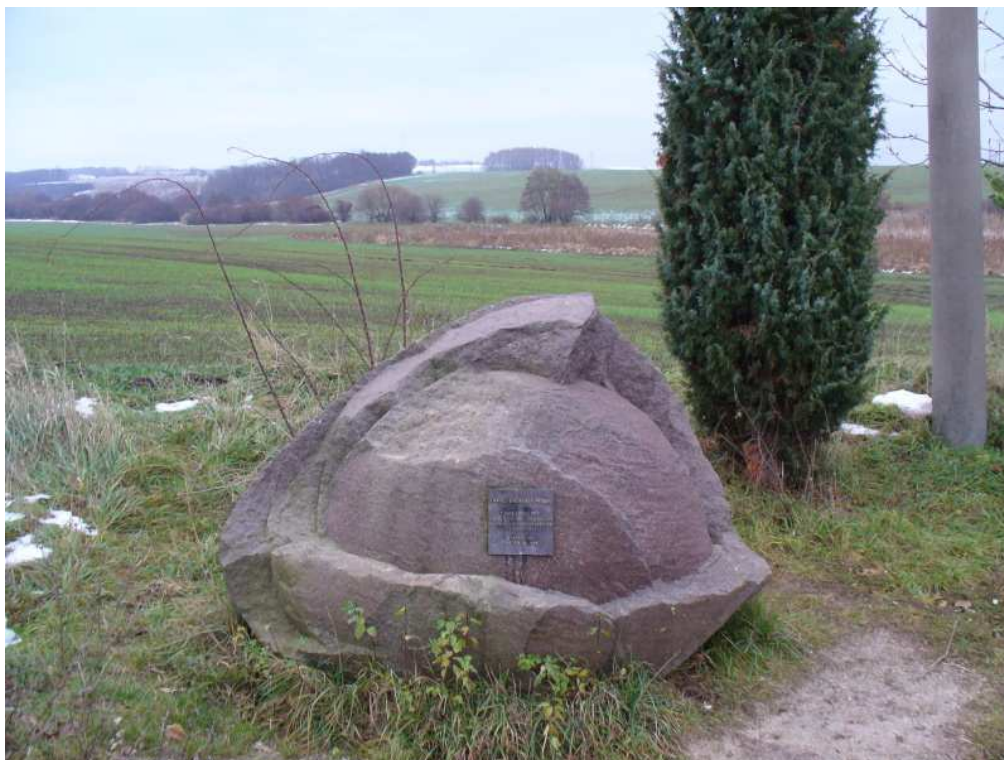
Obr.č. 2 – Čierne Kľačany (Veľkomoravská pyxida)