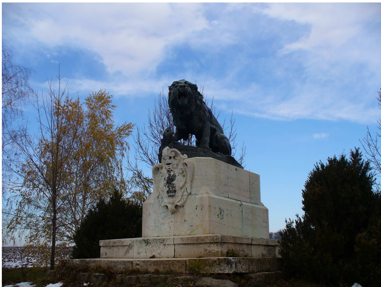
Obr.č. 4 – Veľké Vozokany (Veľkovozokanský lev)