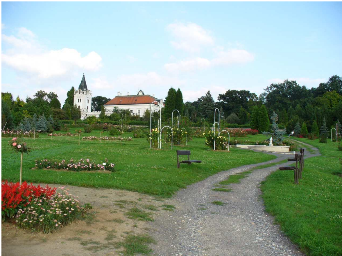
Obr. č.5 – Vieska nad Žitavou (pseudoklasicistický kaštieľ, Arborétum)