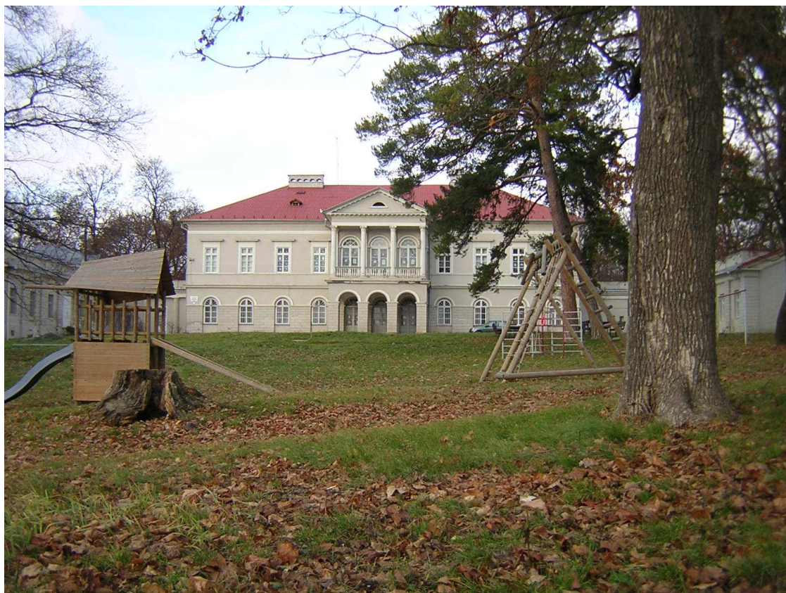
Obr.č. 3 – Tajná (barokovo-klasicistický kaštieľ rodu Révayovcov)