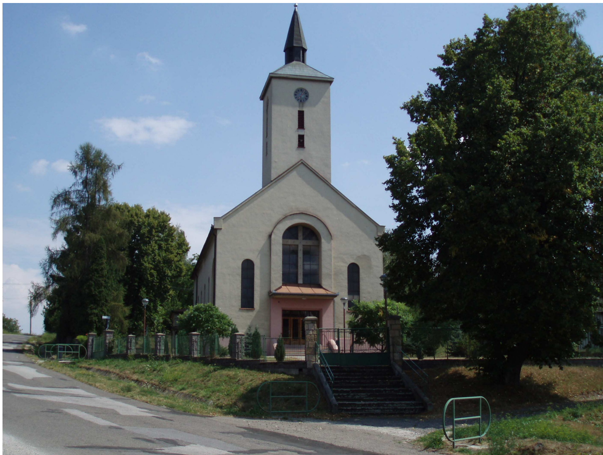
Obr. č.1 – Čaradice (rímsko-katolícky kostol zasvätený Panne Márii)