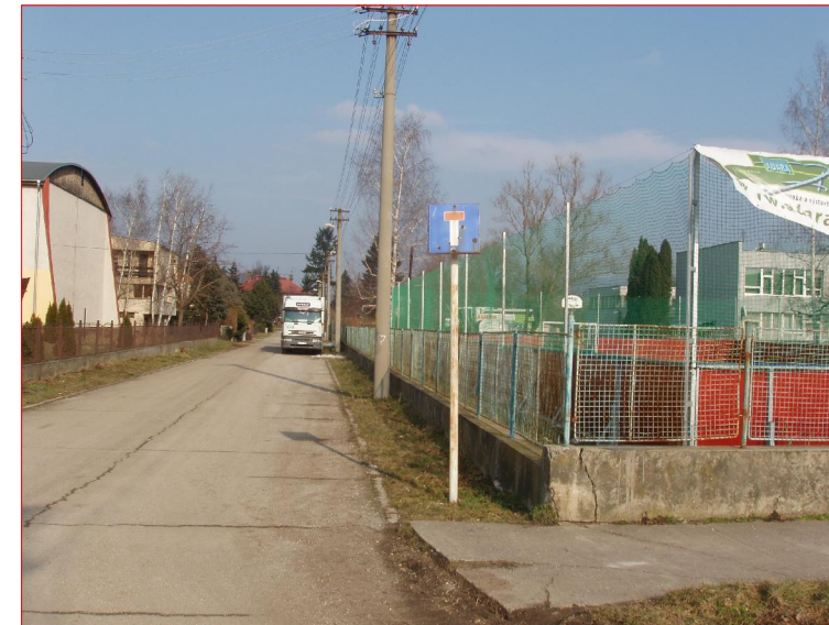
Elektrické vedenie pri areály školy