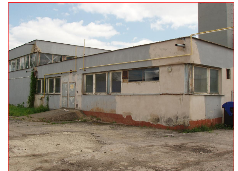
Hlavný prívod plynu do kotolne